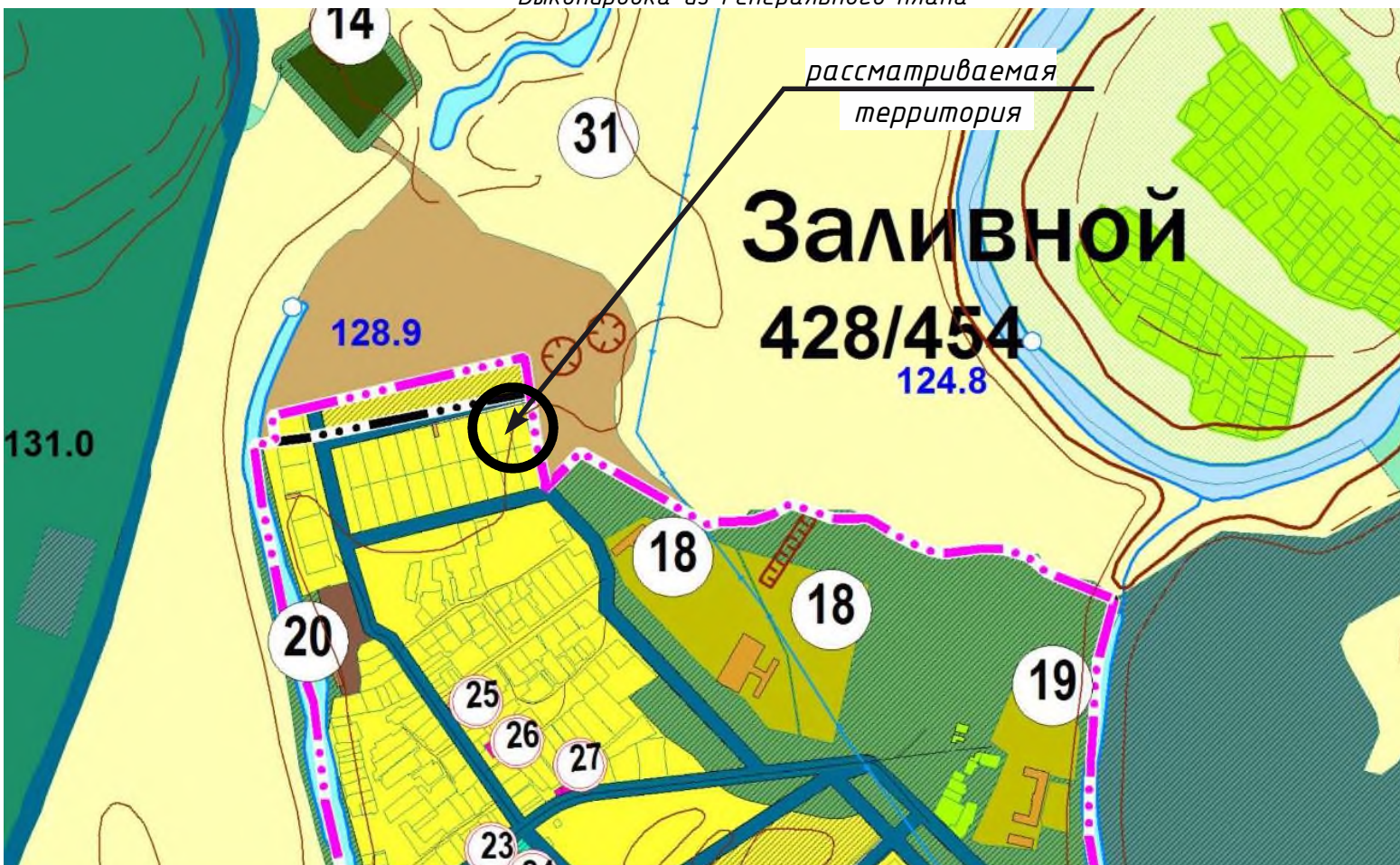
Выкопировка из публичной кадастровой карты