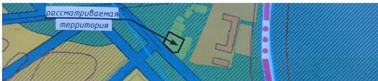
Выкопировка из карты градостроительного зонирования (существующее положение)