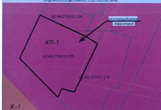
Выкопировка из карты градостроительного зонирования (проектное положение)