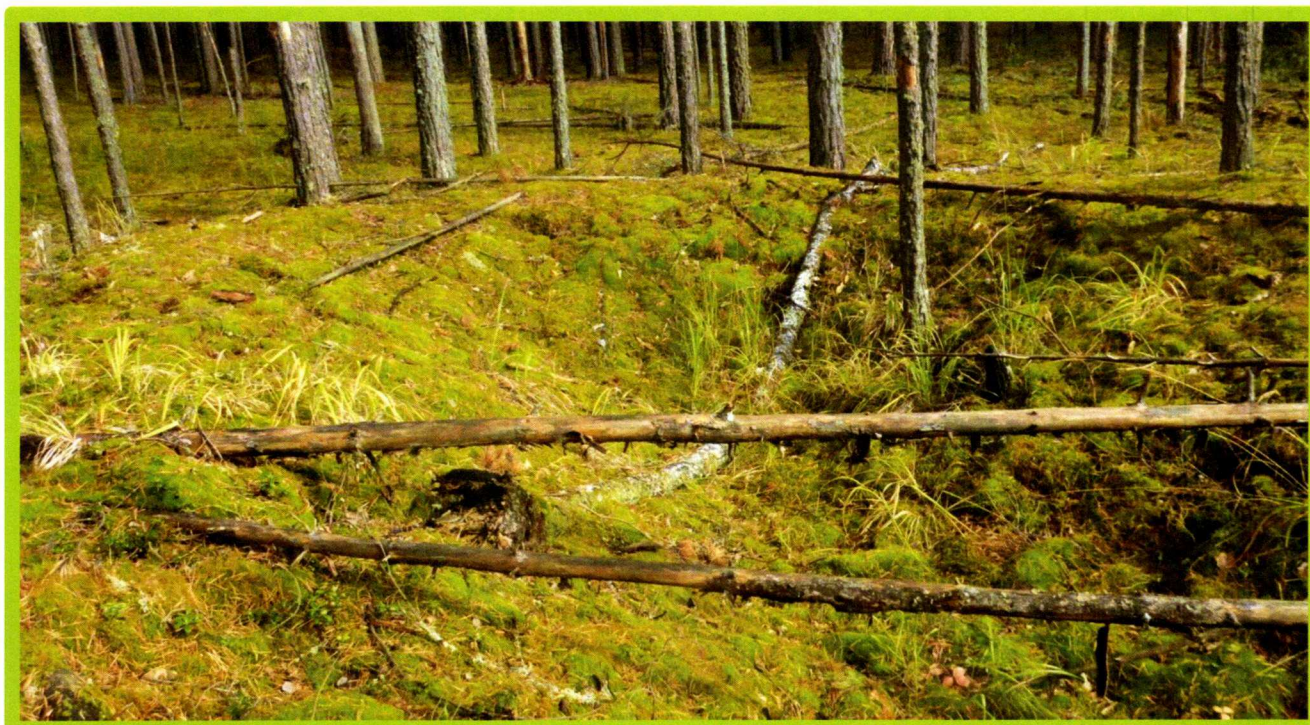
Изображение № 1 Валежник

Примеры валежника (смотри изображения №№ 1,2,3).