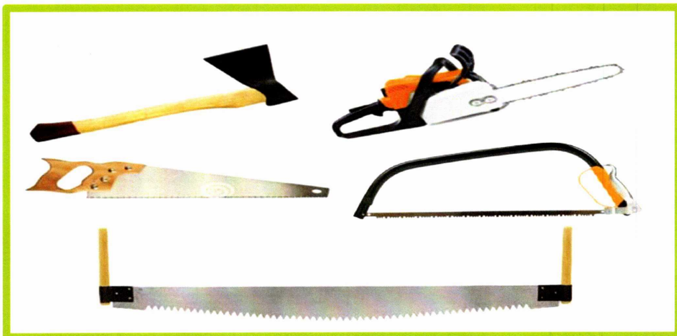
Изображение № 8 Разрешенные инструменты для заготовки

При заготовке валежника допускается применение ручного инструмента (ручных пил, топоров, бензопил) ( смотри изображение 8 ).