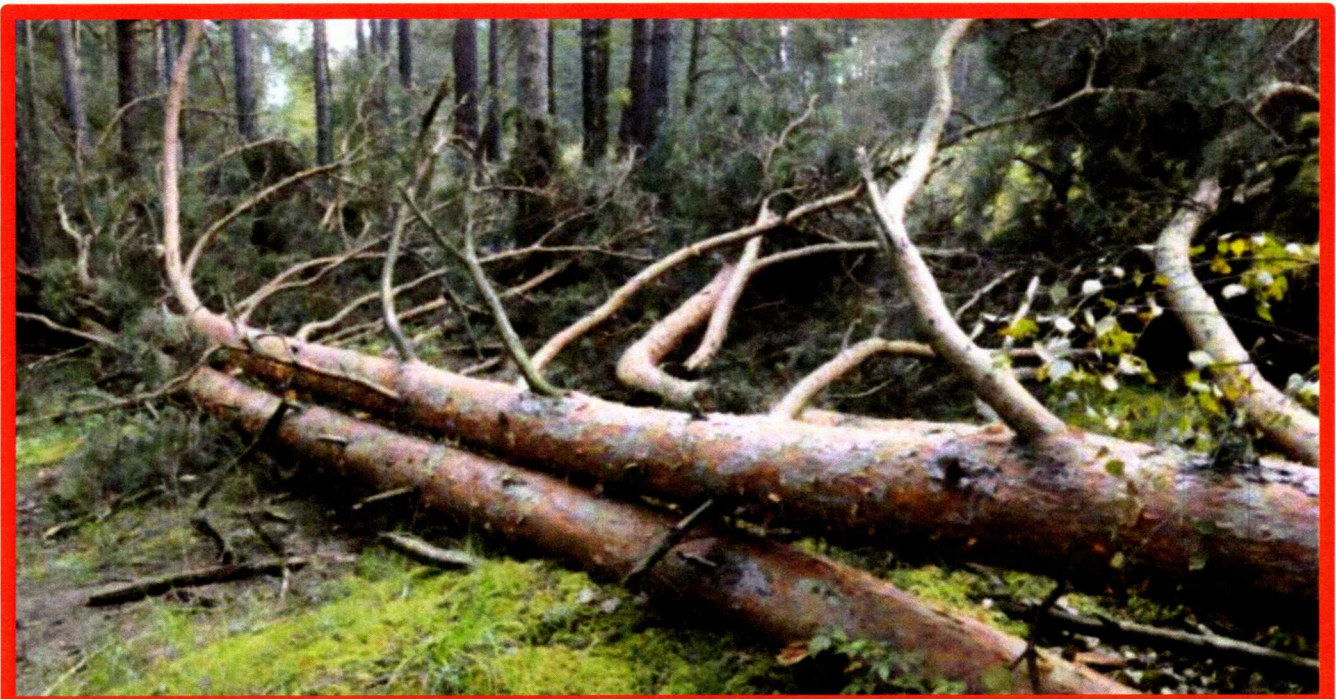
Лежащее на поверхности земли ветровалное дерево, не имеющее признаков отмирания. Не является валежником

Кроме того, необходимо обратить внимание, что деревья, которые лежат на земле, но не имеют признаков естественного отмирания (имеют зеленую листву или хвою), определять как «мертвые» не допускается ( смотри изображение № 5 ).